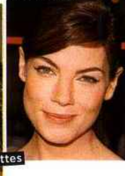
Oct. 2007 : Plaqué racé pour port altier