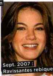
Sept. 2007 : Ravissantes rebiquettes