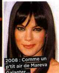
2008 : Comme un p'tit air de Mareva Galanter...