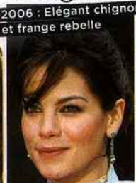
2006 : Élégant chignon et frange rebelle