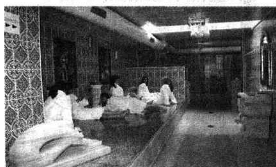
Le hammam les Bains d'Orient vient d'ouvrir place de Stalingrad, dans le 10 e .

■ Tradition chinoise. L'institut Jinna Yu propose des massages chinois bio (pour le corps, une heure à 47 €, massage des pieds pour une heure à 37 €), 17, rue Rennequin (17 e ). Rens. : 01 47 64 12 03.